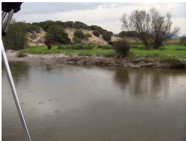
Gita in battello sul fiume Coghinas